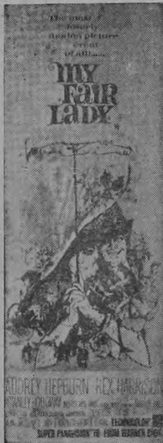
MI BELLA DAMA

Ultimos dias Ya se va del país 3 - 7.30 ..... $ 5.00