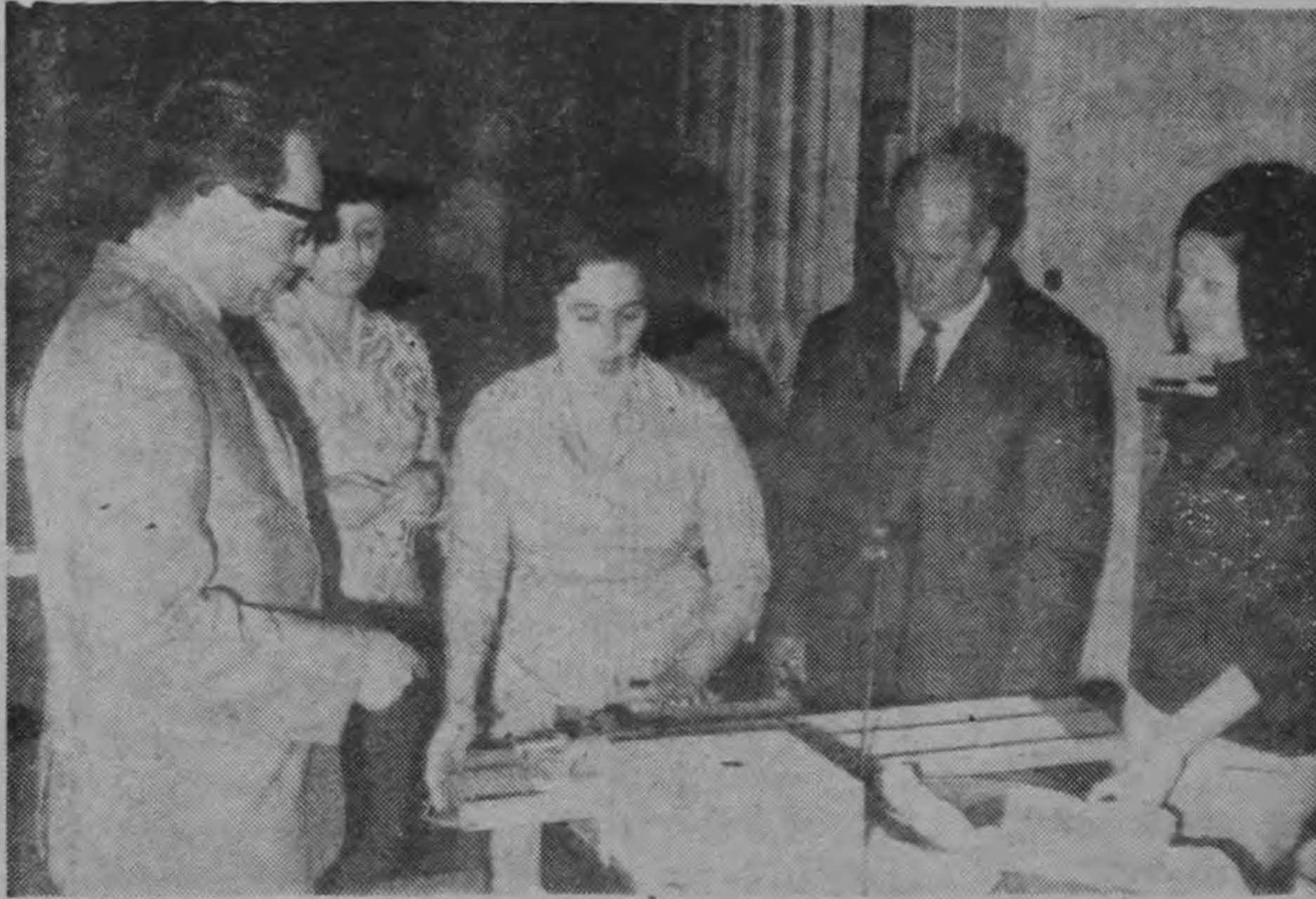
En la Segunda Exposición Nacional de Trabajos de los clubes 4-S, que tendrá lugar en la ciudad de Alajuela durante los días del 21 al 23 de enero, en el Colegio Vocacional Jesús Ocaña, se po-

Se presentarán muchos otros objetos hechos según la edad de los socios, recursos económicos y disponibilidad de la zona donde vivan. Podrá observarse el aprendizaje que se está produciendo en la juventud rural, a través de una labor educativa, sistemática y permanente.